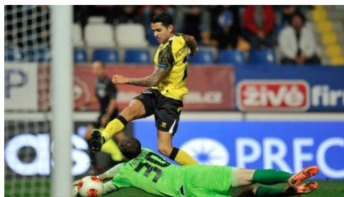
Hroššo inkasuje laciný gól z úhlu